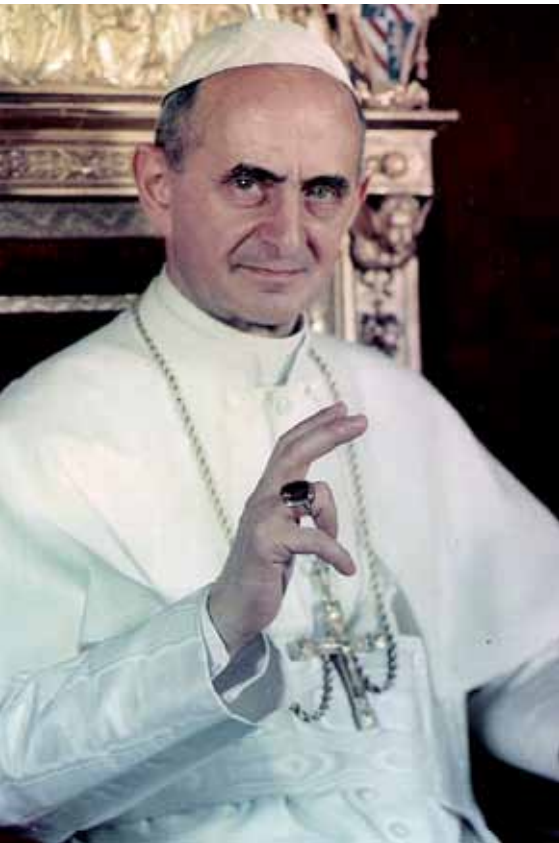
Papst Paul VI. (*1897 +1978, Papst: 1963-1978)

der Kirchengeschichte am aufopferungsvollsten verwirklicht wurde, wo am wenigsten darüber geredet wurde. Die Formulierung und ausdrückliche Parallelisierung mit dem „Gotteskult“ hingegen erscheint fragwürdig und wurde entsprechend kritisiert: „Kult des Menschen“? Muß ein Papst so reden? Muß sich die Kirche in dieser Weise der ungläubigen Welt anempfehlen? Verrät sich in dieser Formulierung nicht die Mentalität der sechziger Jahre, die das Konzil prägte und auch die Liturgiereform imprägnierte?