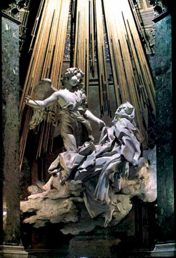
Ekstase der hl. Theresa von Avila (G.L. Bernini, um 1650)

sanktionierte, daß „an diesem Unserem kürzlich edierten Missale niemals irgendetwas hinzugefügt, weggenommen oder geändert werden darf“.