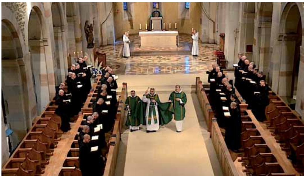
Asperges im Benediktinerkloster Ste. Madeleine (Le Barroux)

Es war der typische Optimismus jener Zeit, die naive Fortschrittsgläubigkeit einer Generation, die nun auch die überlieferte Gebetssprache der Kirche, die Rede von Feinden und von Kämpfen etwa, als unzeitgemäß empfand und durch andere zeitgemäßere Formulierungen zu ersetzen suchte. Jener