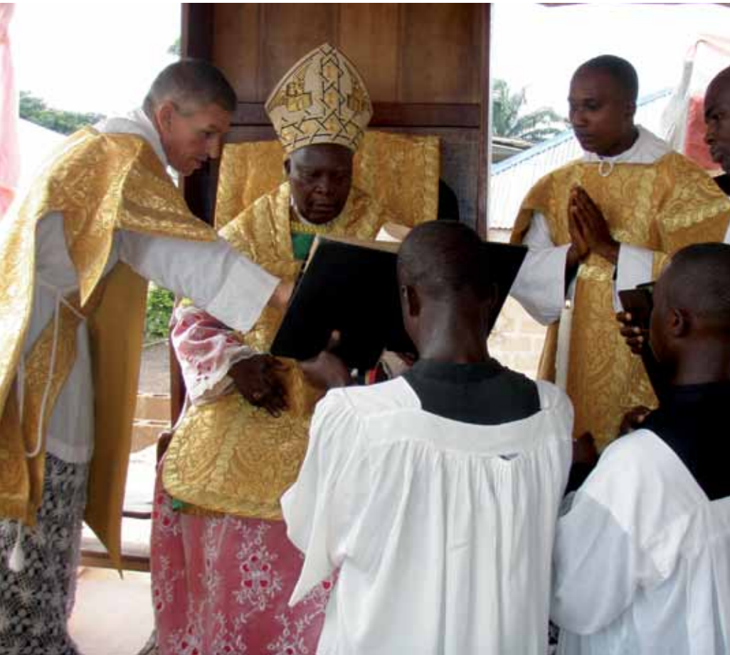
Pontifikalamt in Nigeria

Die Kritik an sogenannten negativen Themen und polemischen Zügen der klassischen Orationen spiegelt eher den modernen Zeitgeist wider, als daß hier theologische Unausgewogenheiten vorlägen, die korrigiert werden müßten.