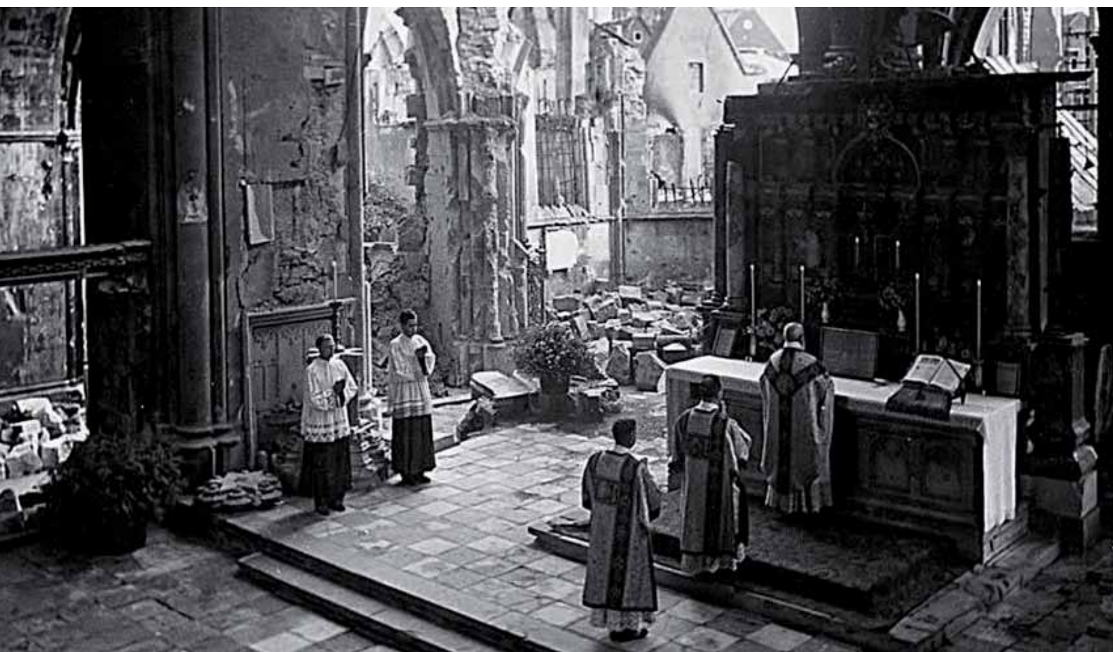
Leviertes Hochamt in Kriegsrüinen

Mit der Schaffung eines Missale, das Einheit im Ritus, Klarheit in den Rubriken und Rechtgläubigkeit im Beten garantierte, das nichts Neues einführte, vielmehr die klassische Ordnung wiederherstellte, indem die liturgische Tradition der römischen Kurie den Maßstab bildete, um Mißbräuche abzustellen und den Ritus von religiösem Subjektivismus sowie sonstigen Über-