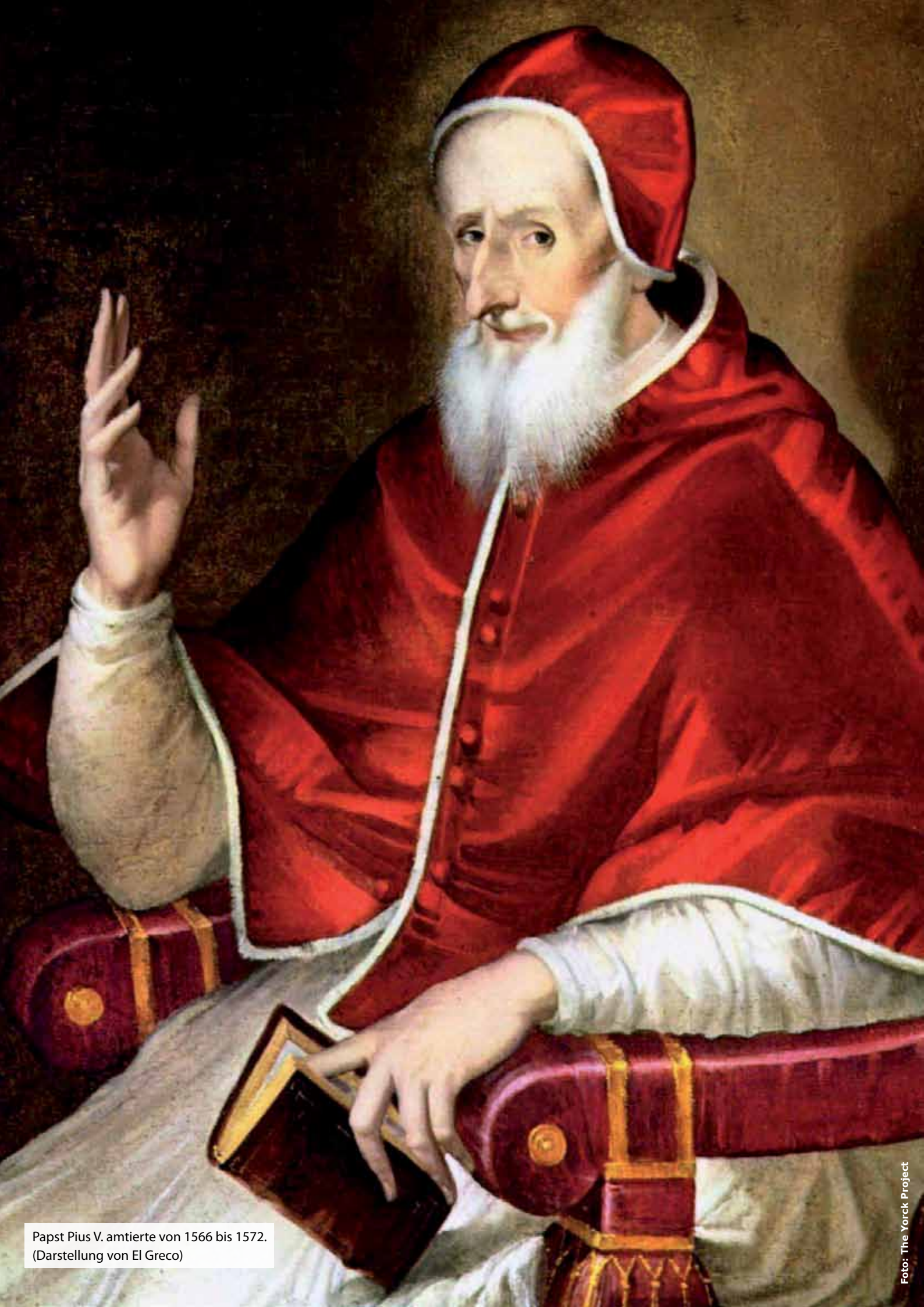
Papst Pius V. amtierte von 1566 bis 1572. (Darstellung von El Greco)